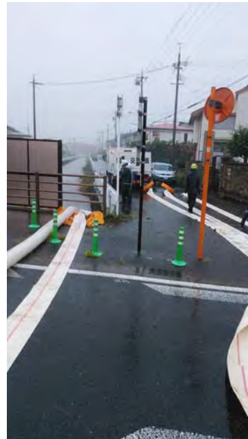
排水ポンプ車稼働状況 (静岡市駿河区西島地先)