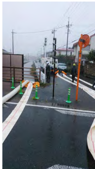
排水ポンプ車稼働状況 (静岡市駿河区西島地先)