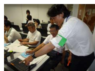
【補助者によるサポートの様子】