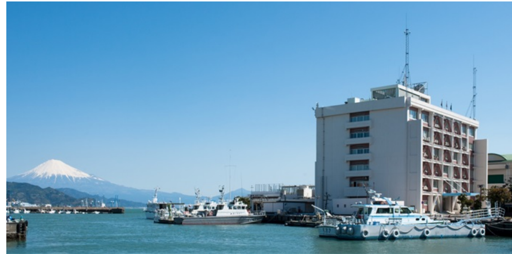
富士山、みなと日の出地区との景観の調和