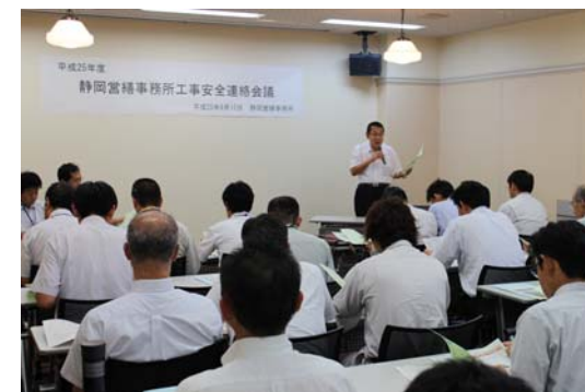
静岡労働局による安全講話