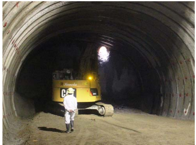
貫通後(工事始点側から)