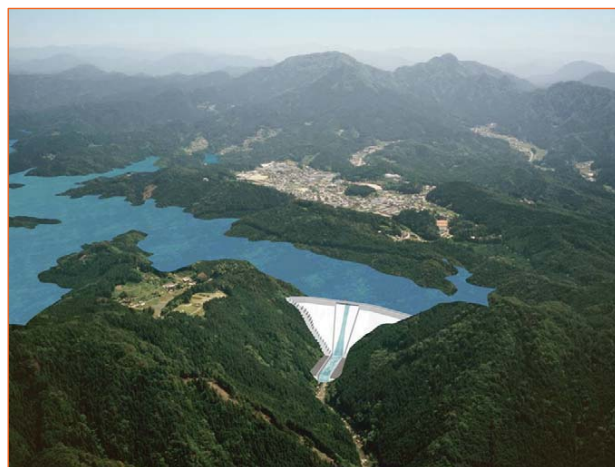
設楽ダム完成予想図 (ダム下流から設楽町田口地区を望む)

今回の事後調査報告書では、現在、事後調査を実施しているクマタカ及び植物の重要な種のうちクマノゴケ、ジョウレンホウオウゴケを対象にとりまとめを行っています。