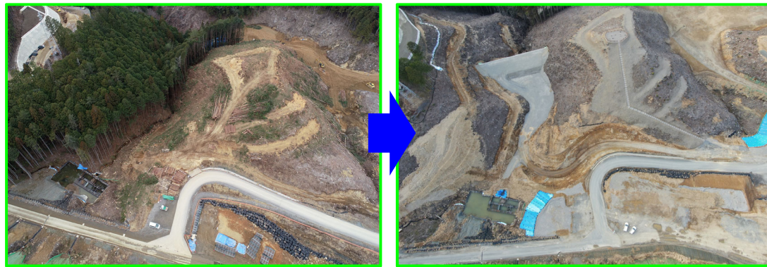
⑬令和2年度 山村都市交流拠点建設発生土受入地整備工事（令和4年3月完成）