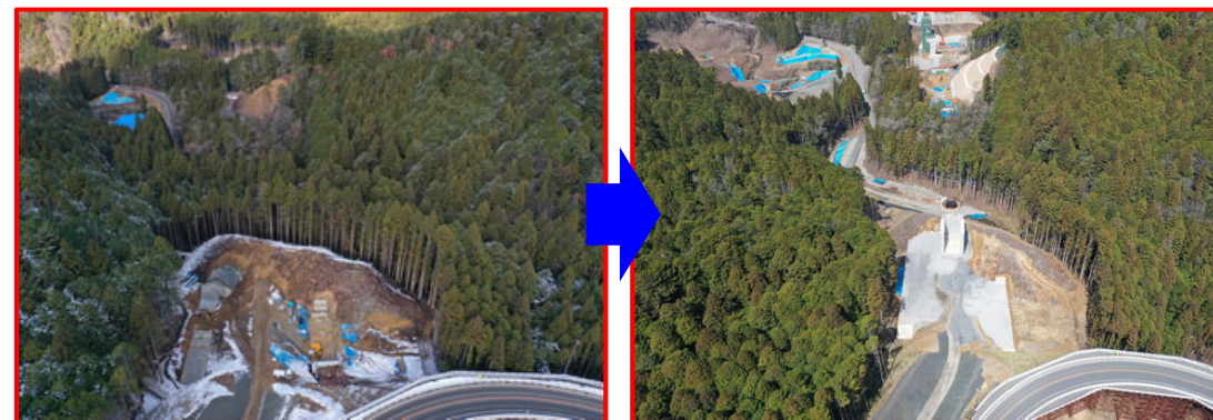
⑱令和2年度 国道257号田口地区橋梁下部工事（令和4年3月完成）