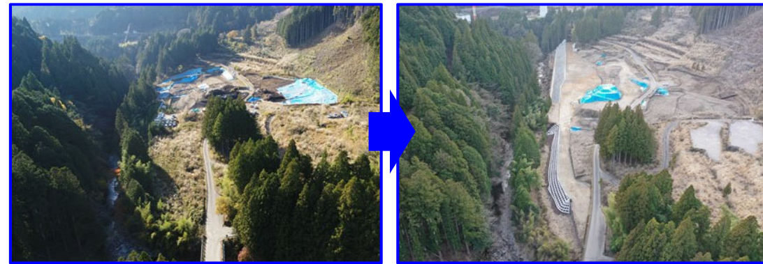
⑯令和2年度 仮設備工事用道路工事（令和4年3月完成）