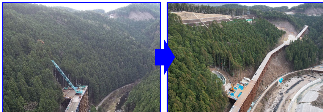
⑮平成31年度 廃棄岩骨材運搬路整備工事（令和4年3月完成）