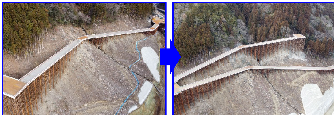
⑭令和2年度 右岸工事用道路工事（令和4年3月完成）