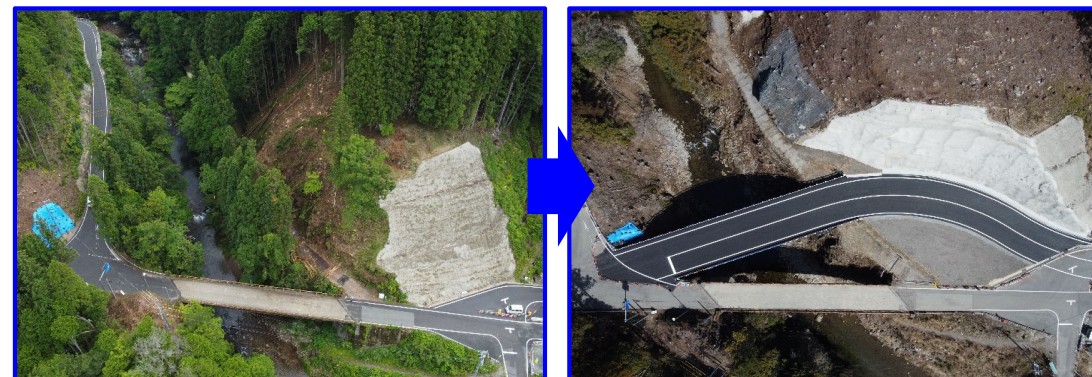
⑰令和3年度 工事用道路整備工事（令和4年3月完成）