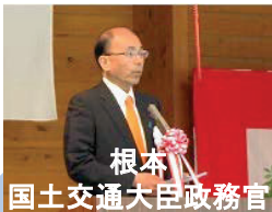
根本 国土交通大臣政務官

今後工事がより本格化していくこととなりますが、安全第一で、事業の推進に努めてまいります。