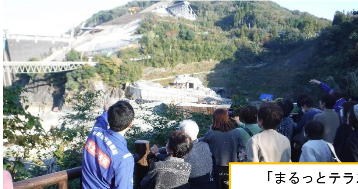
「まるっとテラス」から工事現場を見学