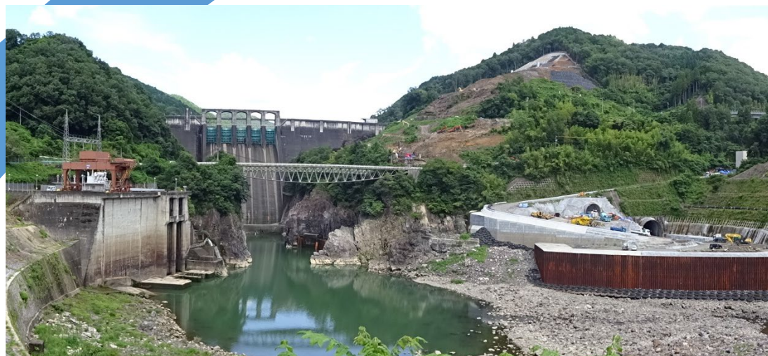
展望台からの眺望