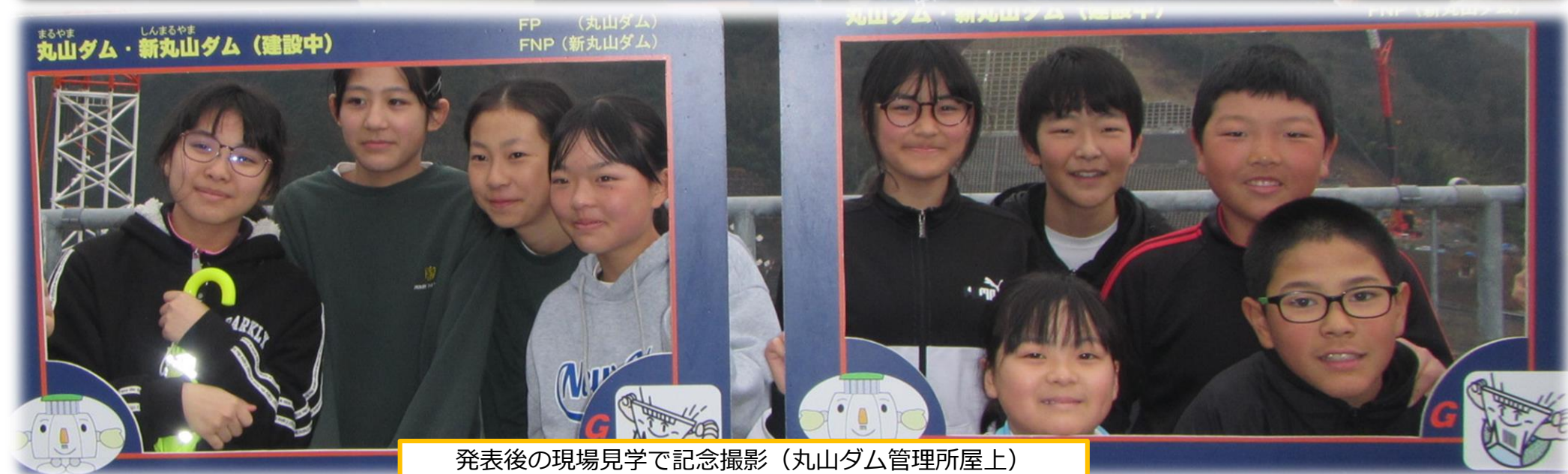
発表後の現場見学で記念撮影（丸山ダム管理所屋上）