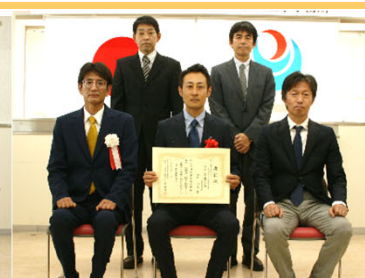
令和3年度 新丸山ダム貯水池地すべり 対策検討業務 日本工営(株)様