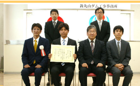
令和4年度 新丸山ダム管内維持工事 (株)土谷組 様