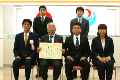
令和4年度 新丸山ダム技術資料作成業務 大同コンサルタンツ(株)様