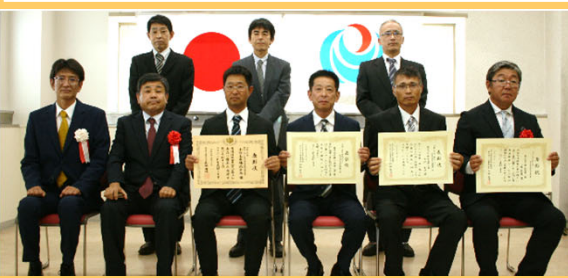
令和3年度 新丸山ダム貯水池右岸仮橋工事 小池土木(株)、(株)横山基礎工事の皆様