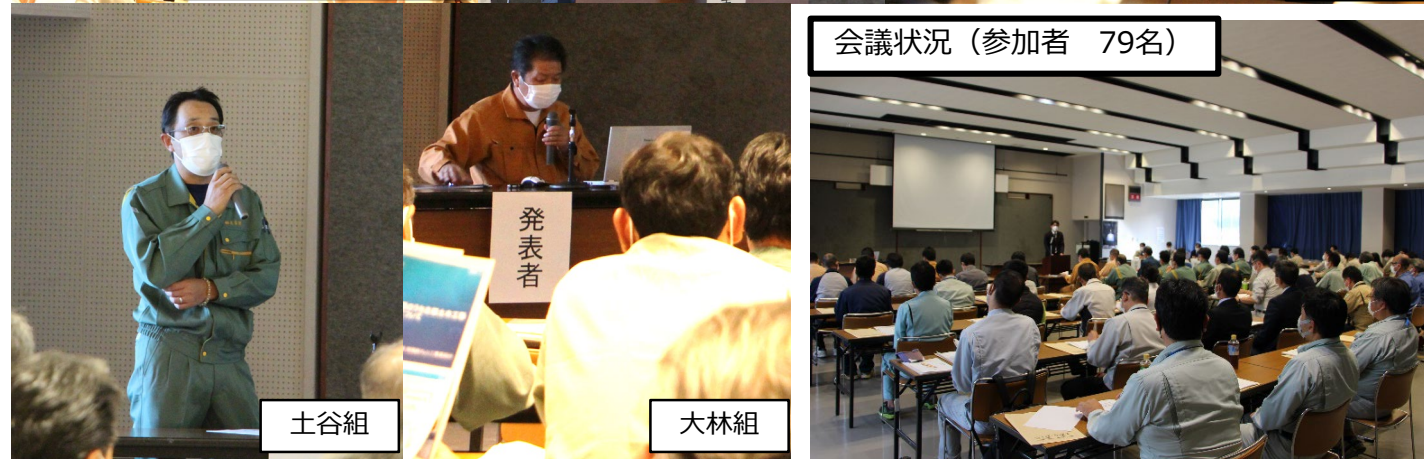
会議状況(参加者 79名)