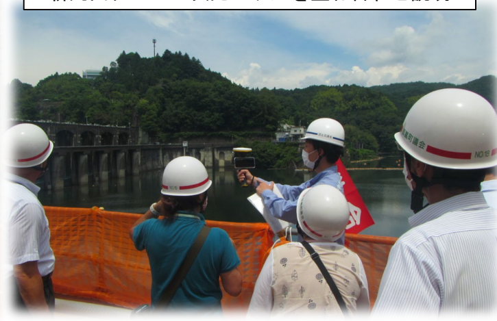
AR（拡張現実）の技術を用いて、実際の現場に 新丸山ダムの3次元モデルを重ね合わせ説明