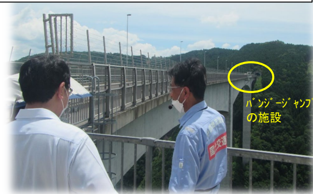
新丸山ダム建設事業に伴い整備した 「新旅足橋」での「バンジー・ジャンプ」の 施設見学等、ストック効果の説明