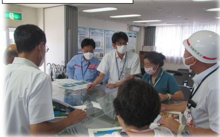
模型を用いて事業概要の説明