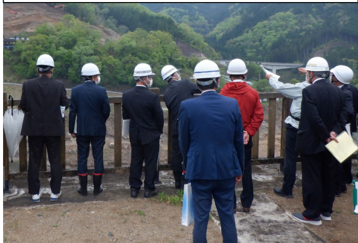
R4事業概要の説明、ダム本体工事の様子を紹介