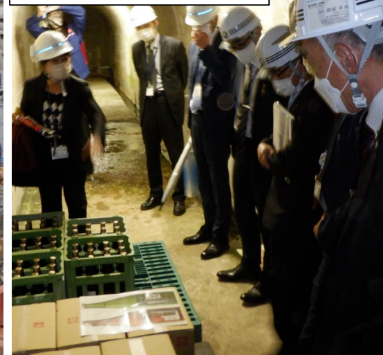
丸山ダム貯蔵酒を見学