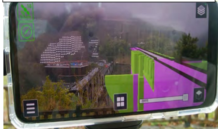
DX活用事例の1つ、AR(拡張現実)を体験