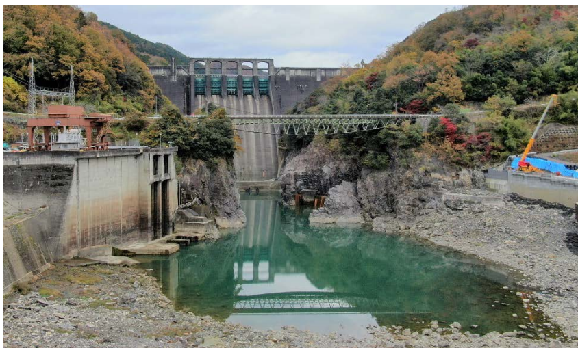
新展望台からの眺め