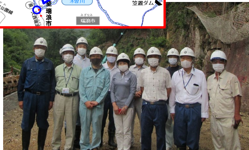
付替道路（県道大西瑞浪線）の早期完成を願い、 日吉地区の道路建設現場で記念撮影