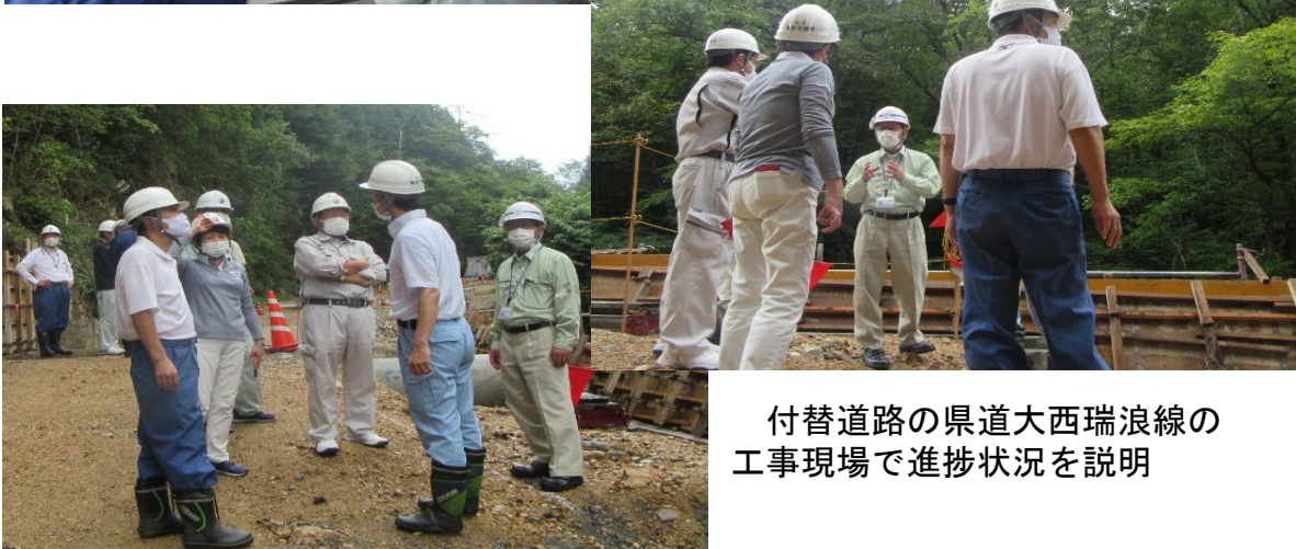
付替道路の県道大西瑞浪線の 工事現場で進捗状況を説明