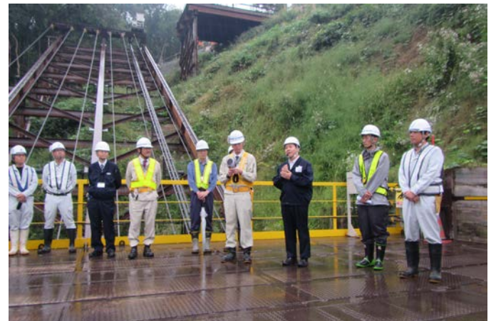
パトロール後 講評