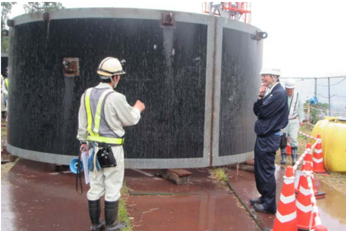
現場パトロール状況