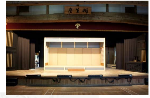
③美濃歌舞伎博物館相生座