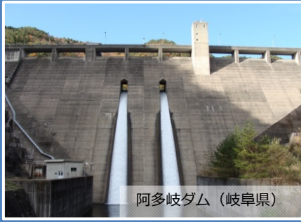
阿多岐ダム (岐阜県)