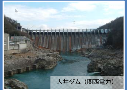
大井ダム (関西電力)