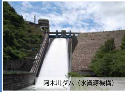
阿木川ダム (水資源機構)