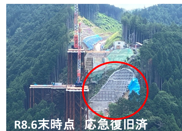
R8.6末時点 応急復旧済