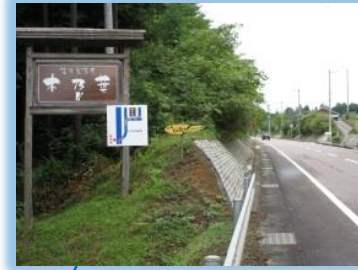
古民家茶屋・陶芸工房