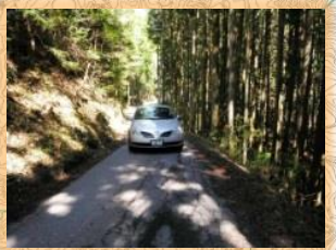
県道恵那八百津線