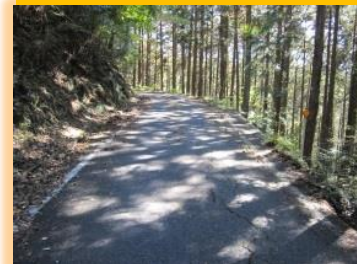
旧県道篠原八百津線