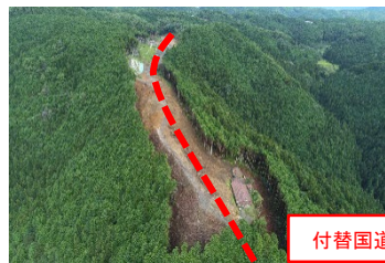
付替国道418号計画路線

令和2年度 新丸山ダム国道418号西山地区道路建設工事 施工者: マルト建設(株) 工事期間: ~令和3年12月23日 工事内容: 山を削り、谷を埋めて道路を作る作業