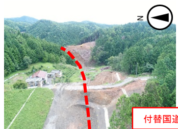
付替国道418号計画路線

令和2年度 新丸山ダム国道418号8号橋川端下部工事 施工者: セントラル建設(株) 工事期間: ~令和3年11月30日 工事内容: 山を削り、地盤高を下げて道路を作る作業 など