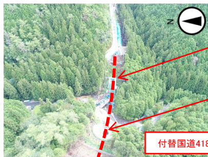
付替国道418号計画路線

令和2年度 新丸山ダム国道418号8号橋下部工事 施工者: セントラル建設(株) 工事期間: 令和2年7月29日~令和4年3月22日 工事内容: コンクリート・鉄筋を使用し橋脚を作る作業