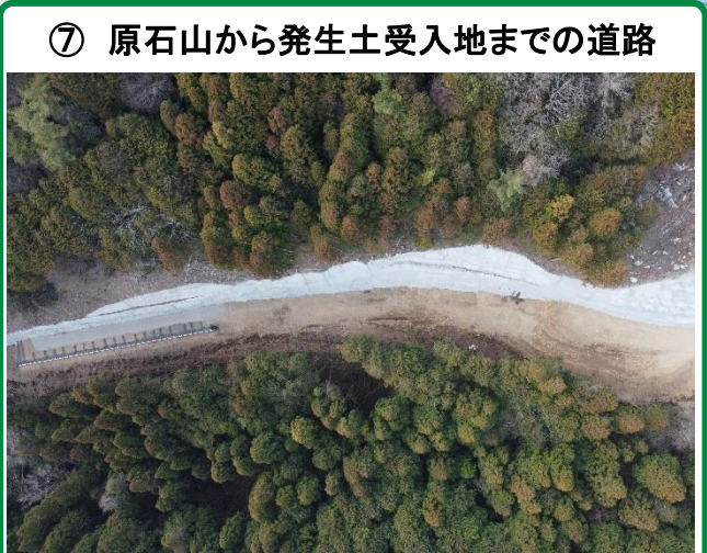
⑦ 原石山から発生土受入地までの道路