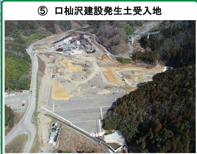
⑤ 口杣沢建設発生土受入地