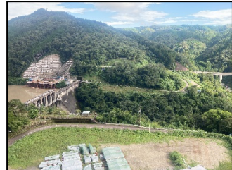
写真B 堤体(右岸より左岸を望む)