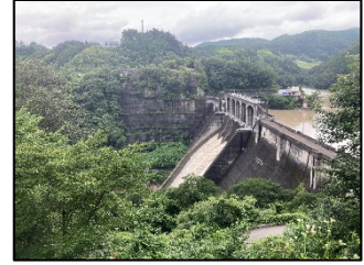
写真D 堤体(左岸より右岸を望む)