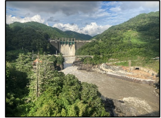
写真A 堤体(下流より上流を望む)