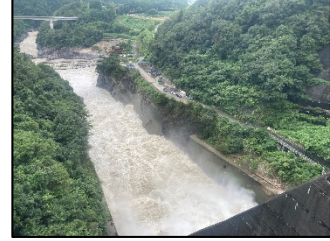
写真C 堤体(上流より下流を望む)