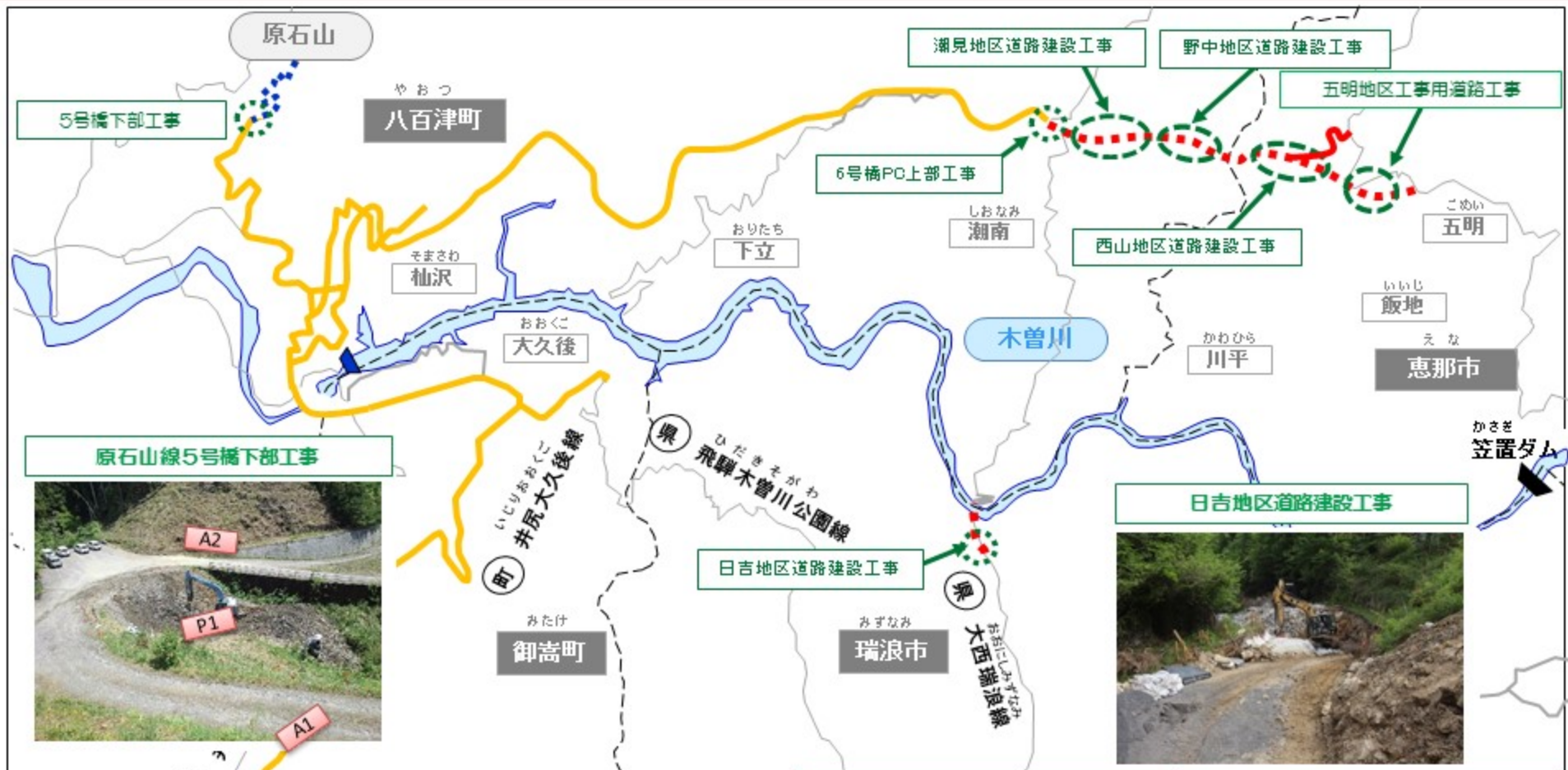
原石山線5号橋下部工事