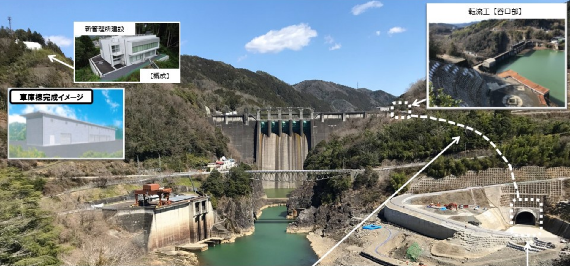
転流工事進捗状況 (令和2年3月末時点)