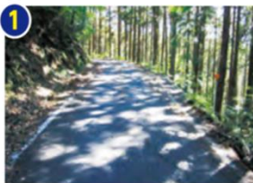
旧県道篠原八百津線