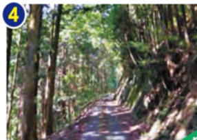
県道井尻八百津線