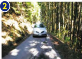
県道恵那八百津線