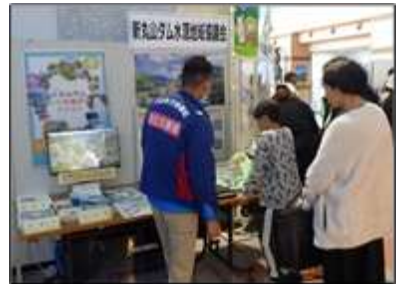
水源地域協議会のブースの様子(R5)