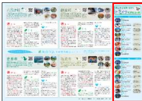
作成したモデルコースを反映した観光マップ