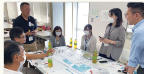
2市2町・ダム関係機関にてモデルコースを作成