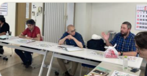
外国人アドバイザーとの意見交換