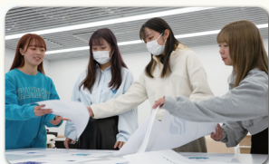
名古屋造形大学の学生にデザインを依頼