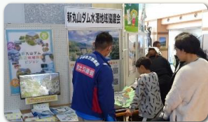
新丸山ダム水源地域協議会 出展ブース