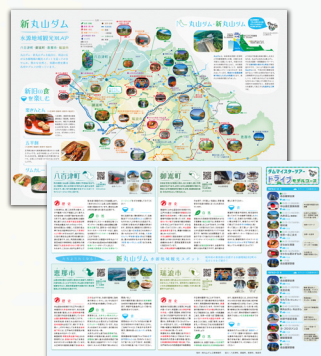
作成したモデルコースを反映した観光マップ