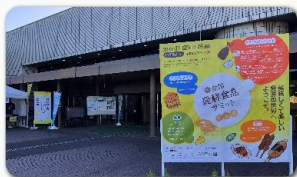
イベント会場の様子(第13回全国発酵食品サミットinえな)