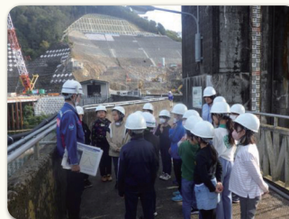
八百津町の小中学校の児童が新丸山ダム本体工事現場を見学