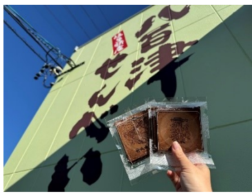
八百津せんべいに自分でダムを焼印