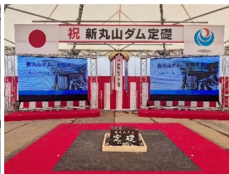
祝新丸山ダム定礎 お祝いムード一色の会場