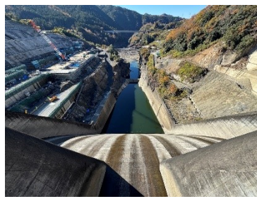
丸山ダムと新丸山ダムの親子写真

丸山ダムツアー無事開催 八百津町観光協会主催の ダムツアーが開催され、編 集長もダムガイドとして参 加しました。今しか見られ ない景色を堪能でき素敵 なツアーになりました。