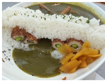
丸山ダムカレーで放流！！