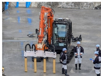
金色におめかした バイバックが大活躍