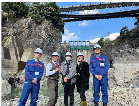
出演者全員で記念撮影

春の訪れを感じつつもまだまだ冷える日が多い丸山ダム地方。季節が進むよりもはやい速度で新丸山ダムの工事が進んで行くことを感じます。訪れる度に左岸の掘削や骨材貯蔵ヤードの変化に驚くばかりです。今の景色を見逃さないよう丸山ダム・新丸山ダムに会いに来てください。丸山ダム4番ゲート水密ゴム取替完了先月号で掲載した丸山ダムの4番ゲートの水密ゴムの取替作業が無事完了しました。新しくなった水密ゴムの効果は靚面！ピタツと水が止まっています。水密ゴムの取替によりよってまた新しい丸山ダムの姿を発見することができました。