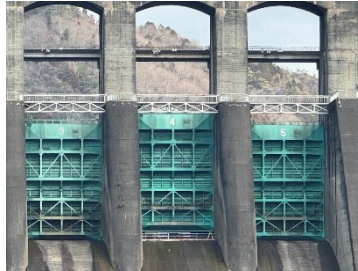
4番ゲートが上がっているとところを拡大

暖冬傾向の丸山ダム地方。久しぶりにまとまった降雨があり2月にしては比較的珍しい放流です。1門放流時は通常3番ゲートからですがとても珍しい1番ゲートからの放流を目にすることができました。普段と違う丸山ダムの新しい景色を堪能し大満足の編集長でした。 丸山ダム4番ゲート水密ゴム取替中 まだまだ活躍する丸山ダムの4番ゲートは現在水密ゴムの取替作業中です。ゲートが上がっていても、上流側に角落しを装着し放流していません。めなんだか不思議な感じがします。