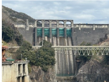
よく見ると1門だけ開いていることがわかる

月刊丸山ダム連載企画『絵でみる丸山ダム』第55回目は昔の名鉄ハイキング乗車券に描かれた丸山ダムです。鬼岩公園から八百津まで、丸山ダム周辺を散策しながら歩く10キロの健脚の方向けのコースが紹介されています。長方形で木曾川を堰き止める丸山ダムのほか展望台や発電所も記載されています。