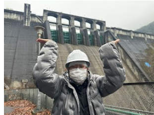
ゲートを持ち上げる！

月刊丸山ダム連載企画『絵でみる丸山ダム』第54回目は新丸山ダムHP内の丸山ダム・新丸山ダムサイズ比較の丸山ダムです。大きさが随分大きくなることや、ダム軸が下流側に移動すること。丸山ダムの下部に乗っかるような形で建設されることがとてもよくわかります。HPを要チェック！