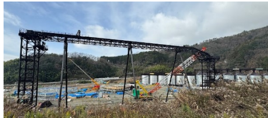
口杣沢の骨材貯蔵ビン達

薄氷が張る程に冷え込み増え、きた丸山ダム地方。キンと冷えた空気の向こうに丸山ダムがよく見えています。丸山ダムはどっしりと構え、新丸山ダム工事は慌ただしく進む、動と静の対比を感じる事が多い今日この頃です。 新丸山ダム骨材貯蔵ビン勢揃い 口杣沢で行われている新丸山ダム関連工事ですが、骨材貯蔵ビンが完成した模様です。ちよつと太つちよな大きい貯蔵ビンやとがり屋根の可愛い貯蔵ビン、頭が平らな3種類が勢揃い。規則正しく並んだ姿がとても頼もしいです。建設現場内に造られてあまり間近で見ることができないと思われている貯蔵ビン道路から見放題です！骨材が入る前の姿を見てみたい編集長でした。