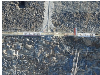
ダム天端&ダム軸表示

秋晴れの空のもと、紅葉が最盛期を迎えている丸山ダム地方。今年も素敵な景色を楽しむことができました。いつか掘削されるであろう右岸の木々の紅葉をあと何回愛でられるのかと思った編集長です。今の景色を目に焼き付けておきたいです。 新丸山ダム左岸掘削一段と進む 先月号で紹介した新たなビュースポットから見る左岸の様子が一か月で大きく変わってきました。掘削が進みダムの本体打設に向けて大きく前進したように感じます。今後注目です！