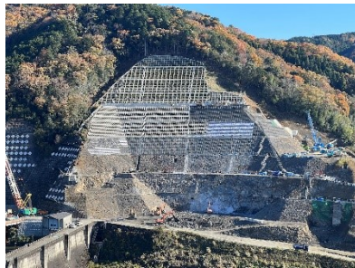
新丸山ダム左岸工事現場

月刊丸山ダム連載企画『絵でみる丸山ダム』第52回目は小冊子『コイ丸くんとゆかいな仲間たち』に描かれた丸山ダムです。精細に描写された丸山ダムは過去いちばんの完成度ではないでしょうか。丸山ダムの周辺で見ることでできる生き物が、コイ丸くんの仲間として沢山紹介されています。丸山ダムに来たら出会えるかも？