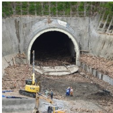
6月4日(日) 復旧工事開始