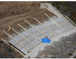
護岸工事拡大写真

日中も過ごしやすい日が増えてきた丸山ダム地方。朝はかなり冷える日もありますが、周辺の木々の紅葉はもう少し先になりそうです。新丸山ダム工事の伐採等で随分木も減りましたが、今年だけの景色に期待しつつ紅葉狩りを楽しみたいですね。新丸山発電所付近護岸の工事本格化。昨年8月の降雨で被害を受け、大型土嚢で応急処置されていた新丸山発電所付近護岸の復旧工事が行われています。護岸を抉っていった水の強さと復旧工事が始まってからの速さ。どちらにも圧倒されています。