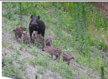
母イノシシと7頭のうりぼう

左岸法面の工事が進む丸山ダム周辺。新丸山ダム建設のための平場を造るためでしょうか？大型土嚢がたーっくさん並んでいます。幾つあるんでしょう？誰か教えて教えてください！