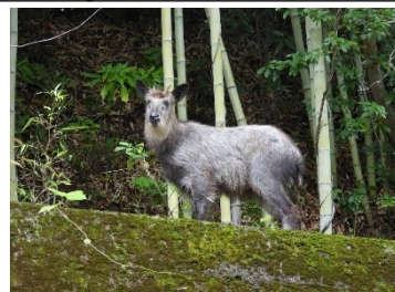
右岸監査廊奥から入口を望む