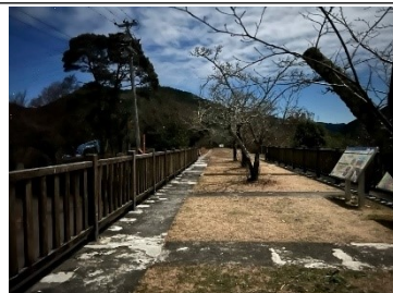
下流から上流方向

丸山ダム展望台 フォトギャラリー 丸山ダム展望台一般開放最 後の夜。新丸山ダム工事事務 所の見学会ではまだ見るチャ ンスがあるようなので見てい ない人は急いで申し込みを！