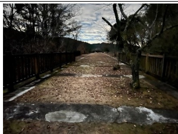
上流から下流方向