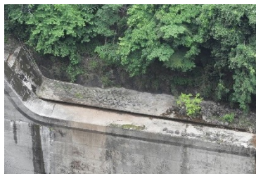
左岸減勢工横が綺麗になった