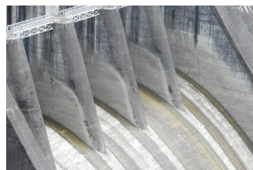
水が流れた高さを感じる

丸山ダム大放流の痕跡 5月21日にたくさん放流した丸山ダム。6月になってもしっかり感じる場所があります。丸山ダムを訪れた際は探してみてください。