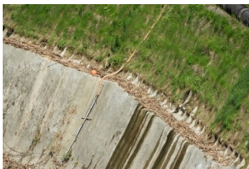
転流工吐口付近の流木と壁面

早い梅雨入りとなった丸山ダムですが、爽やかに晴れる日もあり日に日に気温が高くなっていくのを感じます。ダム周辺の緑も濃くなり葉っぱもぐんぐん成長中。丸山ダムが葉っぱにちよっぴりかくれんぼです。丸山ダム旧管理所解体工事進む ついに旧丸山ダムの管理所の解体工事がスタートしました。毎週末訪れる度に解体工事が進む旧丸山ダム管理所。わかっていたこととはいえ寂しいです。大好きだった看板も無くなってもう見ることができなくなってしまうと実感。後悔が無いように今後も見守ってまいります。