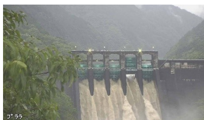
2021年5月21日17:30 放流量 2665.20m³/s

観測史上2番目に早い梅雨入りとなった東海地方。梅雨前線の影響で5月21日大雨が降り丸山ダムにも最大で毎秒4千2百トンを越える水が流れ込みました。見に行きたい衝動に駆られた編集長ですが仕事を休めず心の中で応援しました。丸山ダムゲート操作の謎 令和3年4月からすべてのゲート操作を丸山ダム管理支所が行っていると思われる丸山ダム。ゲートの操作が今までと違ってきます。操作順が変わった？操作ルールが変わった？大好きな丸山ダムのことが全部知りたい編集長。ライブカメラを手エックして観察する日が続いています。丸山ダムゲート操作の謎が解ける日は来るのでしょうか？