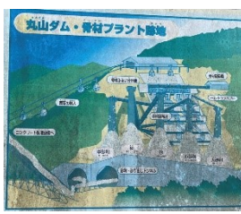
骨材プラント跡地の看板

日に日に暖かさを増す3月下旬。まとまった降雨があり丸山ダム春の放流です。前日夜は全門放流でしたが無念のカメラ電池忘れの為、翌日改めて訪れました。一門放流中の丸山ダムも素敵ですがやはり全門放流をしっかりと撮りたかった編集長です。次回のチャンスに期待です！丸山ダム建設の名残お宝発見！丸山ダム骨材プラント跡地にて当時篩い分けられた中砂利が沢山落ちていた所を発見しました。※中砂利 8〜4cmの大きさの石丸山ダムの一部になり損ねた木曽川の丸石。丸山ダムになっていたかもしれないと思うと途端に興味が出てきます。卵型の可愛い石を2個だけ拾ってきました。玄関に飾っています。