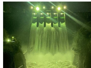
丸山ダムと調査風景

丸山ダム春の放流風景しとすと雨の一日となった3月21日。昼間は放流していませんでしたが夕方から放流開始。みるみる間に全門放流となりました。咲き始めの桜と全門放流の取り合わせが美しく、素敵な夜桜見物となりました。