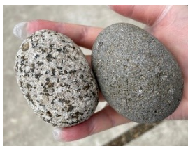
厳選して拾った2個の石