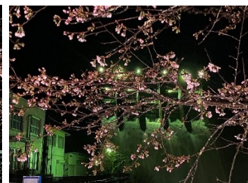
のぞみ橋を見上げる