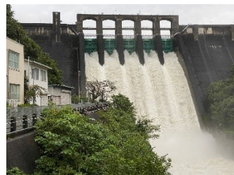
旧管理所付近駐車場より

丸山ダム秋の放流 Photo 10月10日台風14号による降雨により丸山ダムが全門放流していました。当初の予報より少ない降雨量で被害出ず一安心です。撮影時のゲート放流量は6百程度であったと思われれます。迫力のある放流見学でした。