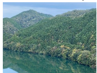
紅葉が始まった丸山蘇水湖

朝晩は寒いと感じる日も多くなってきた今日この頃。丸山ダム付近の木々も少しずつ紅葉が始まりました。気温差が大きいと紅葉は綺麗に色付くのですが風邪などひかないよう気を付けて過ごしたいですね。