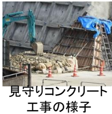
見守りコンクリート 工事の様子

月刊丸山ダム連載企画『絵でみる丸山ダム』第7回目は八百津町内の案内看板に描かれた丸山ダムです。これは？なんとというか黒部？アーチ式のダムが描かれています。丸山ダムと記されています。不思議です。