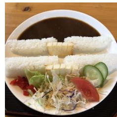
丸山蘇水湖常時満水位