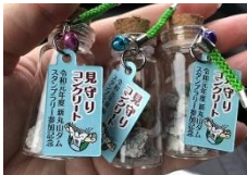
見守りコンクリート