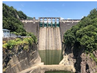
小和沢橋より撮影