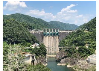
丸山大橋より撮影