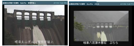
少しだけぶららの更新が早い模様

連日35度を超える程の猛暑が続く丸山ダム。編集長は熱中症に気を付けつつ連日の丸山ダム通いです。ライブカメラの映像が公開された。ぶららからの眺めはなんだか新鮮です。条件を満たせば宿泊することも可能なぶららでいつか泊り会を開催したいと目論んでいますのでその際は奮ってご参加ください。