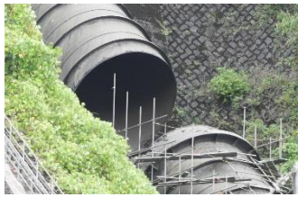
役目を終えた旧水圧鉄管

7月号にも掲載された丸山発電所の水圧鉄管。2本目の交換作業が開始されました。発電所は稼働していることが見て取れるため新水圧鉄管が稼働し始めたようです。旧水圧鉄管を見たい方急いだほうがよさそうです。