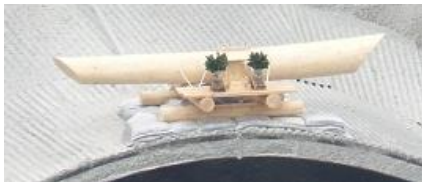
トンネル上部には工事の安全を祈念し御神木が祀られている

新丸山ダム建設のための転流工工事が急ピッチで進んでいます。丸山大橋開通後の景色を時系列で並べました。景色の変化に驚かされます。今しか見る事ができない