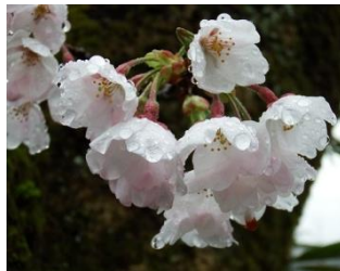
下流の桜もしっとり

今年も丸山ダムに桜の時期が訪れました。桜が5分咲きとなった4月7日毎朝の日課である丸山ダムのライブカメラチェックを行うと、前日から続く降雨により丸山ダムは全門放流していました。平日の金曜日でしたが今年度初の全門放流が気になり会社に着くなり午後休暇を申請しました。どうか仕事を片付け現地に着いたのは午後3時。無事全門放流と桜を目にすることができました。生憎の空模様ではありませんが大満足です。