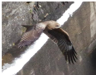
丸山ダムをパトロール中

2017年1月14日・15日にかけて日本列島に襲来した寒気の影響で、丸山ダムにも待望(?)の雪が積りました。私の仕事に影響がなく、予定もない土日の降雪は「丸山ダムが私を呼んでいるに違いない」と思い朝の7時に家を出発し馳せ参じました。8時を少し過ぎ到着した時には、堤体に雪は積もっていませんでしたが周辺は白銀の世界で雪に濡れて堂々と佇む丸山ダムを引き立てていました。